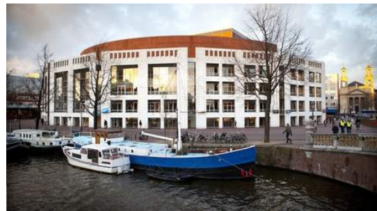
De Stopera, waar de actie zal eindigen

Stop de huurexplosie, de verkoop van sociale huurwoningen en de gedwongen verhuizingen. Met onder meer die eisen storten woninghuurders uit Amsterdam en omgeving zich in de verkiezingsstrijd.